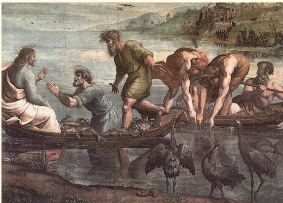
〈고기잡이 기적〉(라파엘로작, 1515-1516년경)

제2독서는 예수님께서 누리시는 영광이 모든 이를 위해 당신 자신의 소중한 목숨을 바치신 고귀한 희생에서 우러나온 것임을 강조한다. 십자가에서 돌아가신 그분이야말로 하늘과 땅에 있는 모든 피조물이 외치는 영원한 경배의 대상이기 때문이다.